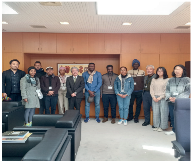
Photo3. With staffs of National Museum of Ethnology and my African friends, 08 December 2023.

My visiting experiences: I gained very important experiences from visiting the historical Japanese National Museum of Ethnology, Kyoto International Manga Museum, Chado Research Centre, and Terra Renaissance organized by IAFPs. The overall efforts of establishing the National Museum of Ethnology also gave me insights into how Japan is contributing to the world's anthropological and Ethnological research. Kyoto International Manga Museum also taught me a lot about how Art universities can make a difference in archiving the community's art and saving values for future generations. The Terra Renaissance also taught me how humanity makes a difference in supporting humanity itself and making a sense of life to the ultimate vision and destiny.