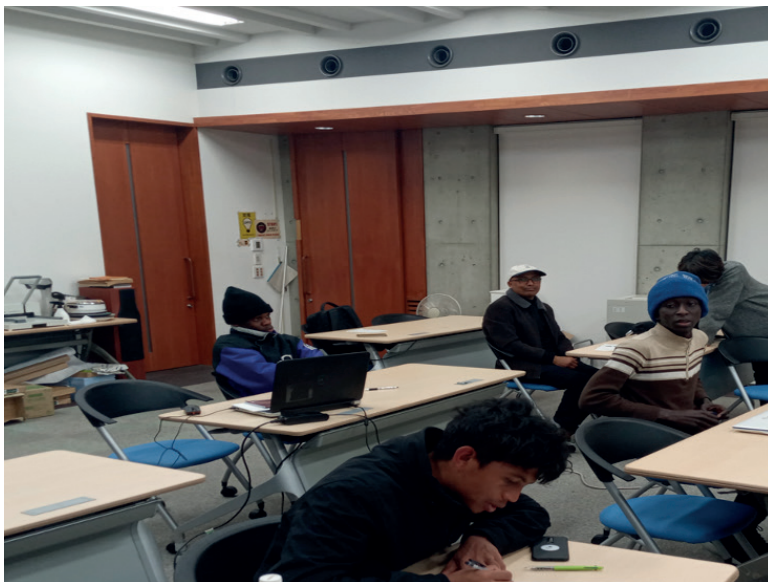
Photo 2. During my final examination of the Japanese Language, 08 Dec 2023.

My unforgettable Japanese Language Class: Throughout my Japanese Language classes, a delightful mosaic Japanese writing system blending kanji, hiragana, and katakana told me how Japanese fathers and mothers were very dedicated to sharing deep concepts, and native identities, respecting others' identities and adding flavors to indigenous and diverse expression. Every moment of the class was enjoyable with my African friends from Madagascar, Senegal, Tanzania, the Democratic Republic of Congo, and Ethiopia.