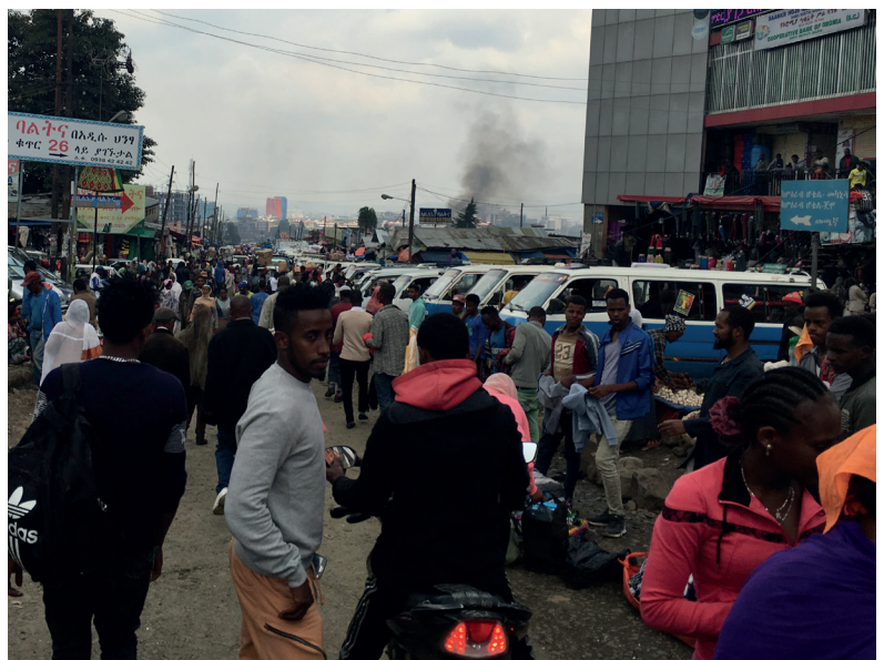
Photo 1. Minibus station with crowd in Markato market

The Addis Ababa city government has initiated various transport modernization projects collaborating with international organizations since the early 2000s. However, contrary to expectations that formalization would diminish their role,