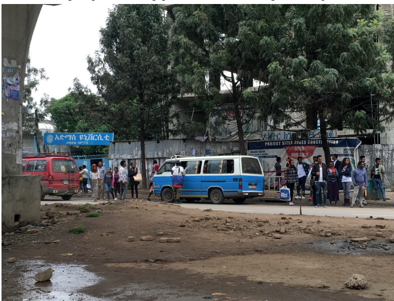
Photo 2. Tera Askebari and number of passengers waiting for the vacant minibus

Despite their success, the tera askebari face ongoing challenges. Regulatory pressures, competition with formal transport services, and the uncertainties of urban development pose significant risks to their operations. Moreover, their informal status often leaves them vulnerable to the social welfare system. Addressing these challenges requires a nuanced understanding of the value they add to the urban transport system and a willingness to engage with them as legitimate stakeholders in the city's development. I would like to argue that future policies should aim to harness their strengths and integrate them into a more inclusive and flexible urban transport strategy, since their practices can offer a blueprint for integrating informality into urban planning and policy, challenging traditional notions of development and modernization.