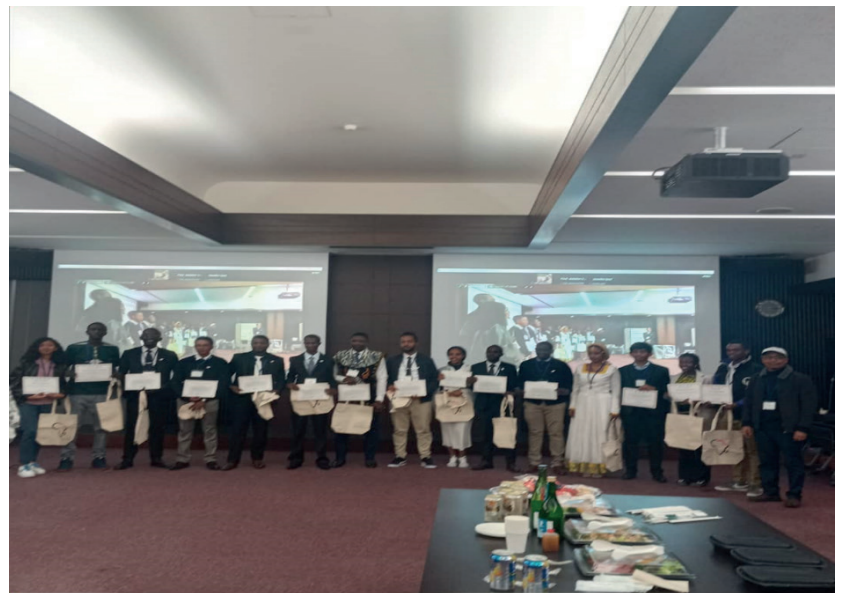
Photo 1. At closing ceremony of the 4th International Conference of IAFPs, 18 Dec.2023.

I observed the university’s dedication to academic excellence and research innovation throughout the African-Japan-engaged research seminars and conferences held during my stay. Research seminars, innovative Africa and SDGs sessions, and weekly academic advice gave me an exciting opportunity to learn different perspectives. The presentation at the 4th international conference held on 18 December 2023 was the best opportunity to know African and Japanese researchers.