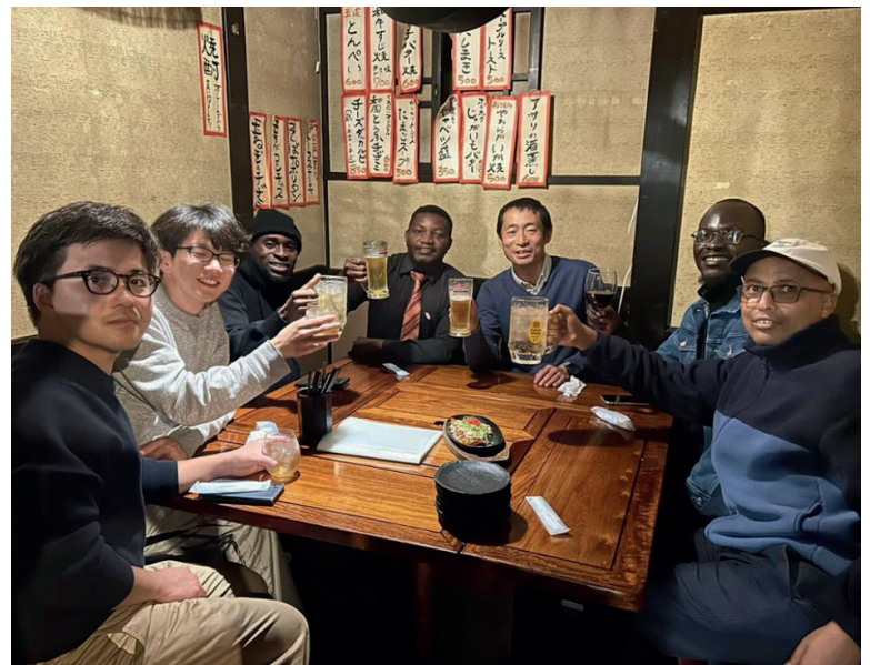
Photo 5. Enjoying my Professor's invitation to dinner with my Zambian and Japanese friends after the weekly meeting, 14 December 2023.

Socialization at work and outside: The staff at Kyoto University-ASAFAS demonstrated exceptional sociability and warmth, creating a comfortable and inclusive environment for international students. The faculty members were approachable and provided valuable guidance and support, enhancing the academic journey. The professors were also friendly and engaged in meaningful discussions. The Japanese people encountered, whether at supermarkets, restaurants, or in daily life, were kind, polite, respectful, and cooperative. I enjoyed a variety of Japanese cuisines, such as Okonomiyaki, Ramen, Sushi, and Soba.